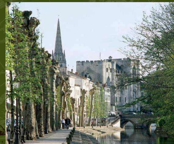
Quai de la Regratterie à Niort (Deux-Sèvres), lieu de production et de traitement des peaux en provenance de Nouvelle-France.

Les résultats de l'inventaire sont disponibles sur l'Internet. Ils sont accessibles à tous et c'est à chacun - particulier, association, collectivité - d'investir ces nouvelles données. La valorisation de ce patrimoine en puissance passe désormais par son appropriation par le public : pour que de simples traces d'histoires ces lieux deviennent " lieux de mémoire ".