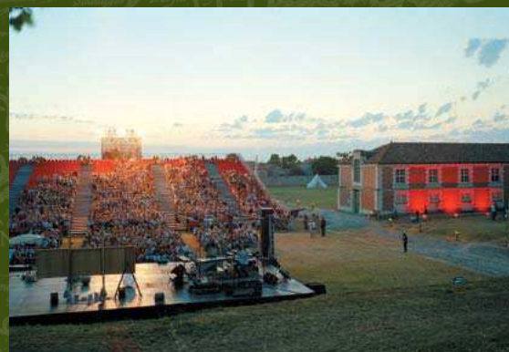
2004, Brouage accueille le spectacle de Yannick Jaulin pour commémorer le 400 e anniversaire.

D'autres lieux ne concernent finalement qu'un petit groupe, la mémoire est ici plus familiale (plaques commémoratives ou maisons natales d'ancêtres). La plupart des lieux recensés demeurent inconnus du public et attendent une possible mise en valeur. Ils constituent un véritable enjeu, économique et touristique non seulement pour les Canadiens, sensibles au " tourisme généalogique " (circuits thématiques), mais aussi pour les Picto-charentais qui découvrent ainsi un nouveau patrimoine sur leur territoire.