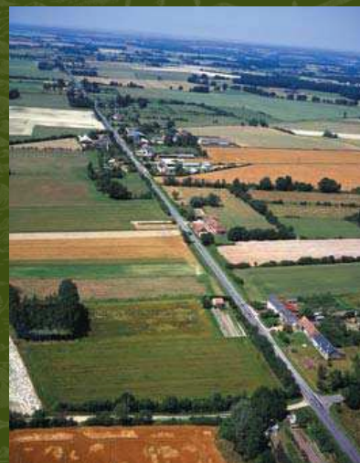
La " Ligne acadienne ", Archigny (Vienne).