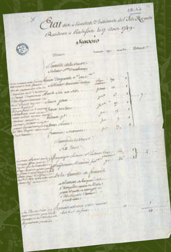
Liste des habitants de l'Île Royale résidant à Rochefort en 1749, SHM Rochefort. Service historique de la Marine.