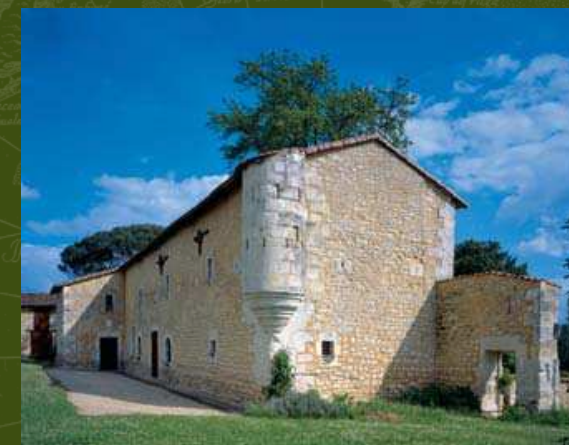
Vue du logis Du Vivier, Chalais (Charente).

Le programme d'inventaire a fait émerger un patrimoine lié à la Nouvelle-France. Un nouveau regard est alors porté sur ces traces architecturales variées.