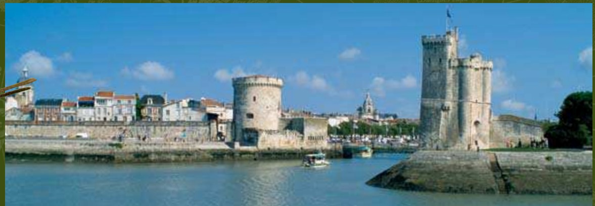
Vue du port de La Rochelle (Charente-Maritime).