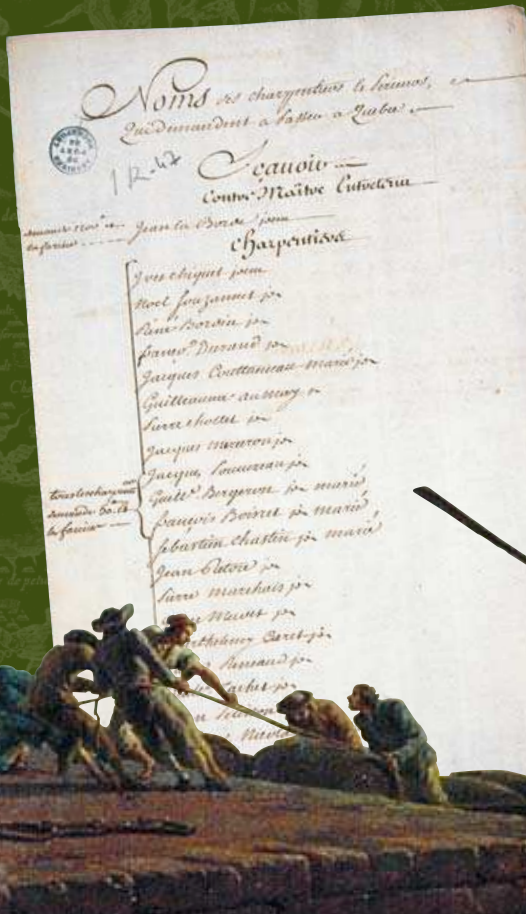
Liste de passagers. Service Historique de la Marine, Rochefort.

Les recherches généalogiques permettent de préciser les mouvements de population entre ces deux territoires.