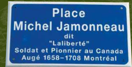
Plaque de rue Michel Jamonneau d'Augé (Deux-Sèvres).