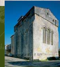
Eglise paroissiale Saint-Grégoire (Augé, Deux-Sèvres), vue du chevet, lieu de baptême de Michel Jamonneau.